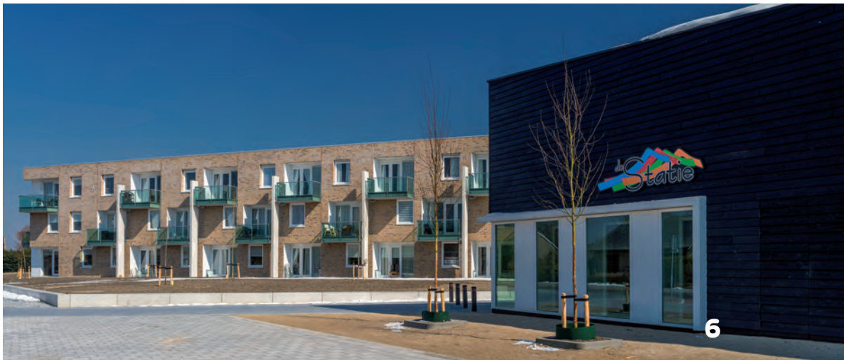
1. Het buurtcentrum in De Statie. 2. Het open karakter van De Statie. 3. De bibliotheek. 4. Het grillig gevormde gebouw. 5. Trap als onderdeel van het interieur. 6. Rechts De Statie, links de seniorenwoningen • Foto's Petra Appelhof en John Lewis Marshall.